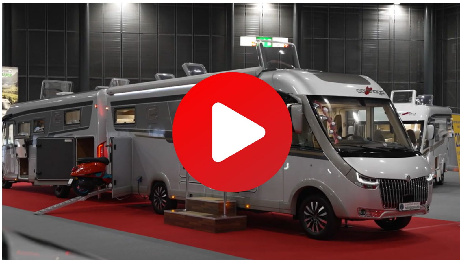
Caravanning Brno 2023