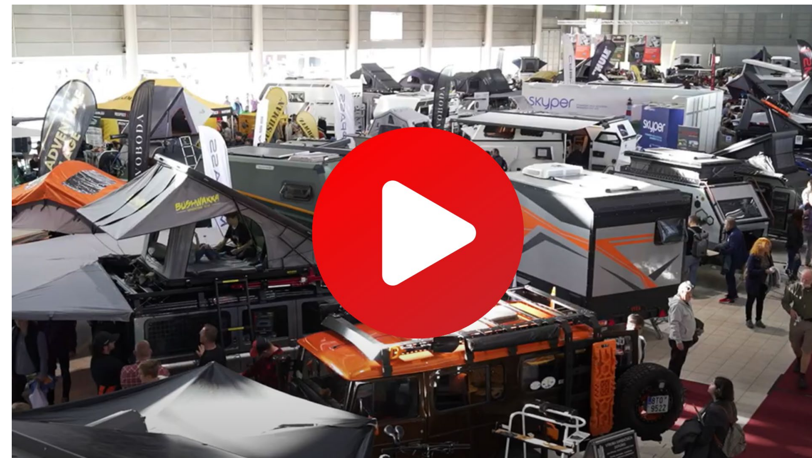
Adventure Hall na Caravanningu Brno 2023